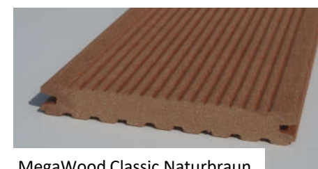
MegaWood Classic Naturbraun