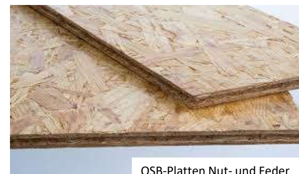
OSB-Platten Nut- und Feder